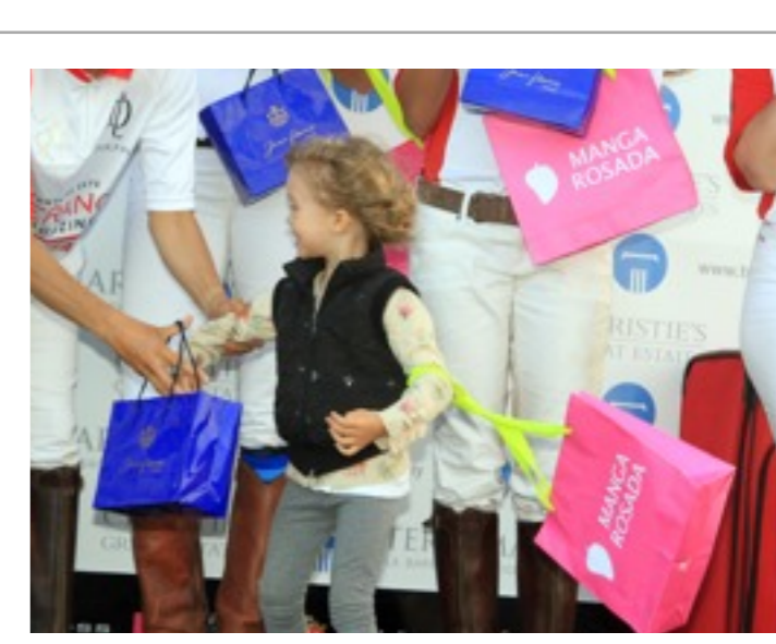
EXPOSICION DE LOGO MARCA