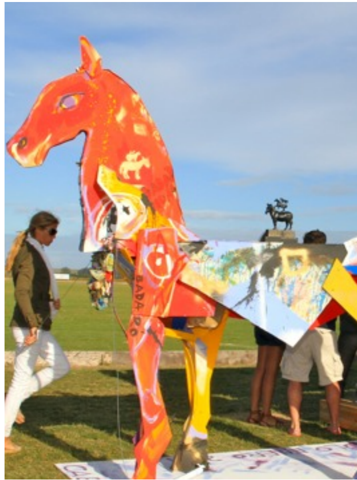
Arte en Caballo Solidario / Copa Art Terramar 2011